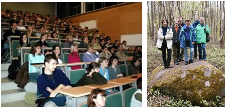
Ryc. 5. Aktywność Oddziału Poznańskiego w latach 1998-2011, wykład oddziałowy (lewa); wycieczka terenowa do Sierakowskiego Parku Krajobrazowego (prawa)