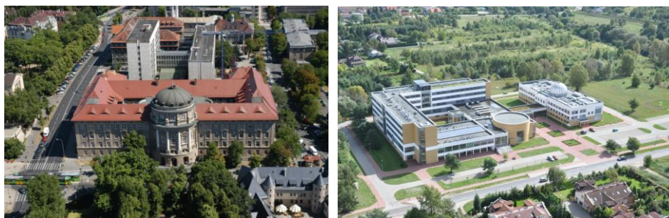
Ryc. 2. Siedziby Oddziału Poznańskiego PTG: gmach Collegium Minus , ul. A. Fredry 10 – siedziba poznańskich geografów w latach 1936–2006 (Archiwum WNGiG) (lewa); obecna lokalizacja Wydział Nauk Geograficznych i Geologicznych w kampusie uniwersyteckim na Morasku, ul. B. Krygowskiego 10, z kolistą aulą Collegium Geographicum im. Profesora Stanisława Pawłowskiego (fot. A. Kijowski) (prawa)

Siedziba Oddziału Poznańskiego PTG mieściła się w Instytucie Geografii na ul. Fredry 10 w Poznaniu (od 1936 r. rezydowało tam Towarzystwo Geograficzne w Poznaniu), a odczyty odbywały się w pomieszczeniach Instytutu. W 2004 r. oddział wraz z Wydziałem Nauk Geograficznych i Geologicznych przeniósł się do nowego obiektu na terenie Kampusu Morasko, obecnie przy ul. B. Krygowskiego 10, a zebrania i spotkania odbywają się w salach Collegium Geographicum (ryc. 2). Oddział Poznański PTG realizuje swoją działalność statutową dzięki wieloletniej przychylności władz dziekańskich Wydziału Nauk Geograficznych i Geologicznych 2 .